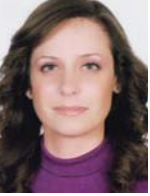
Salma Hayek Gestion des bourses au Liban