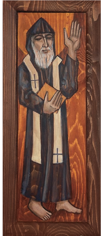
St Charbel Makhlouf (1828-1898)