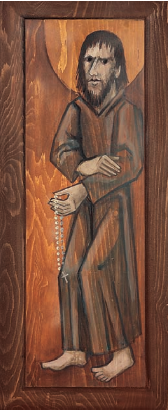
St Nicolas de Flue (1417-1487)