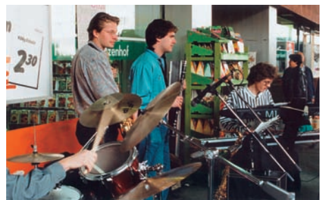
Groupe de musique du même collège, Horgen 1991