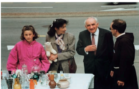
Comité de Solidarité Liban-Suisse, Horgen 1991