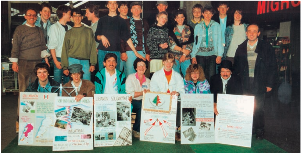
Carob Marché aux puces à Horgen, 1991