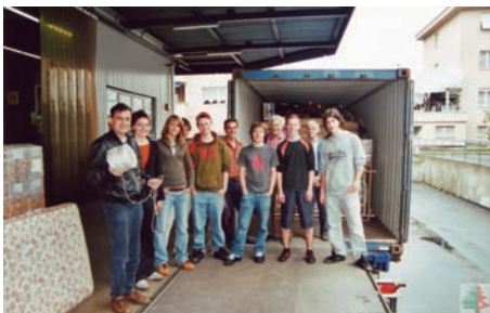
Equipement, médical offert par Fresenius, Stans, 2005