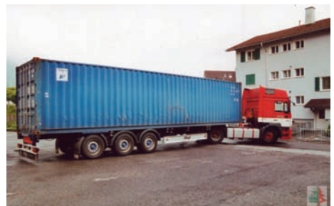
Equipement, médical offert par Fresenius, Stans, 2005